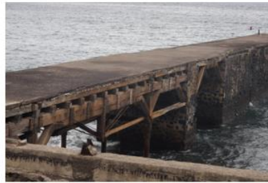
Ilustración 1 VALdesco SC Tenerife

«En esta fábrica [textil] trabajaban 1.500 personas, y más de la mitad tienen menos de quince años. Se dice que no se admite a nadie menor de nueve, pero algunos niños, dado su aspecto, podríamos suponer que tenían uno o dos años menos. [...] El trabajo comienza a las cinco y media de la mañana y termina a las siete de la tarde, con altos de media hora para el desayuno y una hora para la comida. [...] Los hombres [...] estaban casi tan pálidos y delgados como los niños. Las mujeres eran las de apariencia más saludable, aunque no vi ninguna de aspecto locano, [...] vi [...] hombres y mujeres que no llegarán a ancianos, niños que no serán adultos sanos [...]». C. TURNER THACKRAH. Los efectos de los oficios, trabajos y profesiones, y de las situaciones civiles y formas de vida sobre la salud y la longevidad, 1832